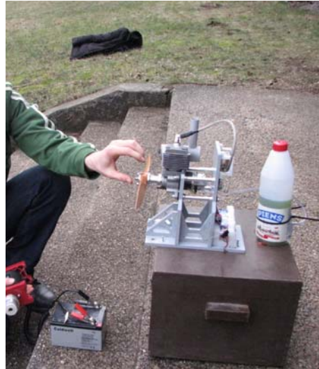
Dzinēja stends testu veikšanai

RTU Projektu pārvaldības departamenta Projektu ieviešanas un uzraudzības nodaļa nodrošina sekmīgu projekta administratīvu vadību un sniedz atbalstu projekta aktivitāšu īstenošanai.